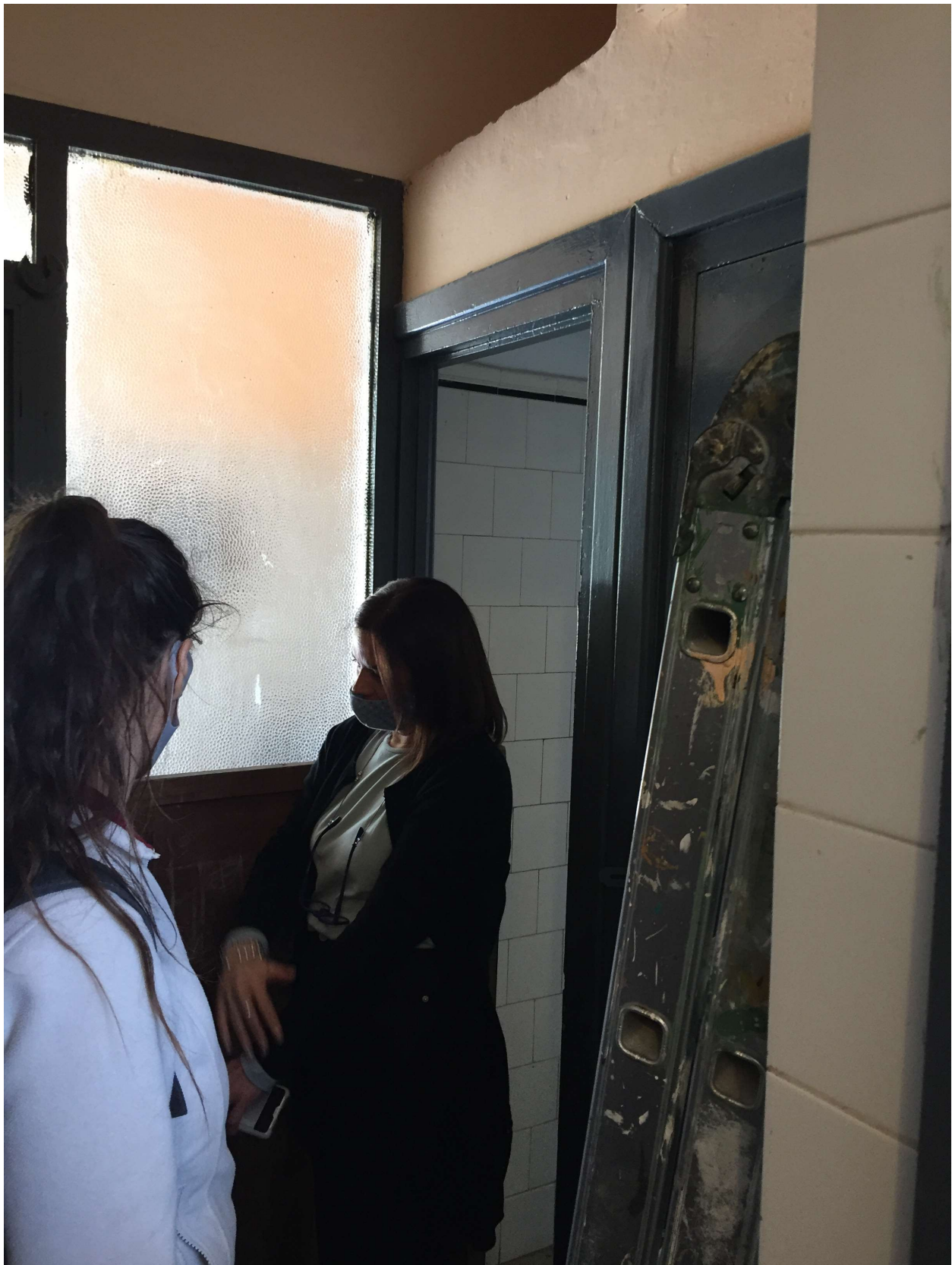
Ingreso y deposito bateria de baños

dri dirección sectorial de infraestructura