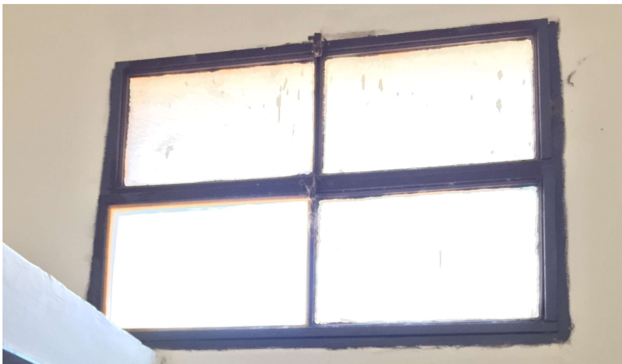
Ventana hierro sector A