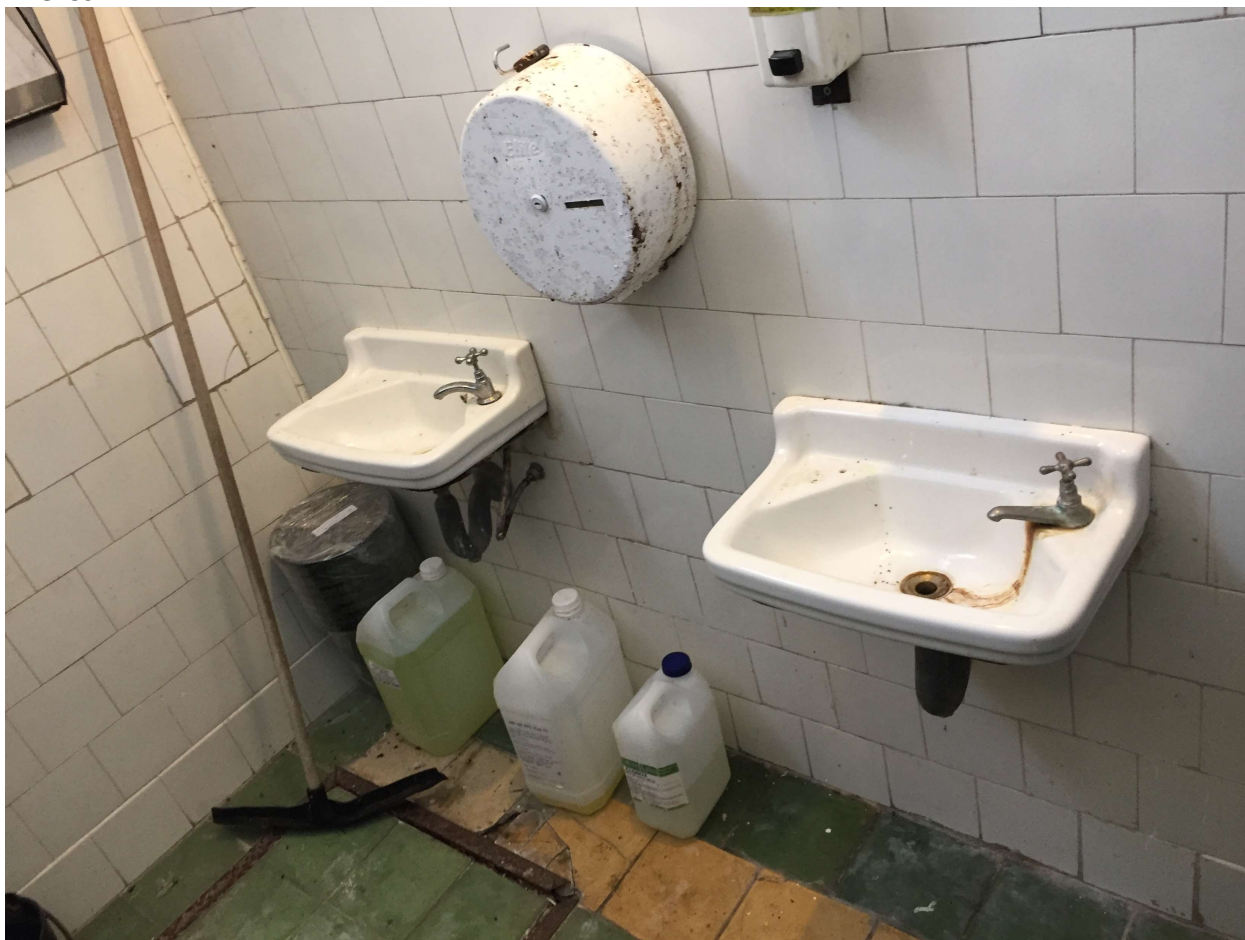
Baño sector A