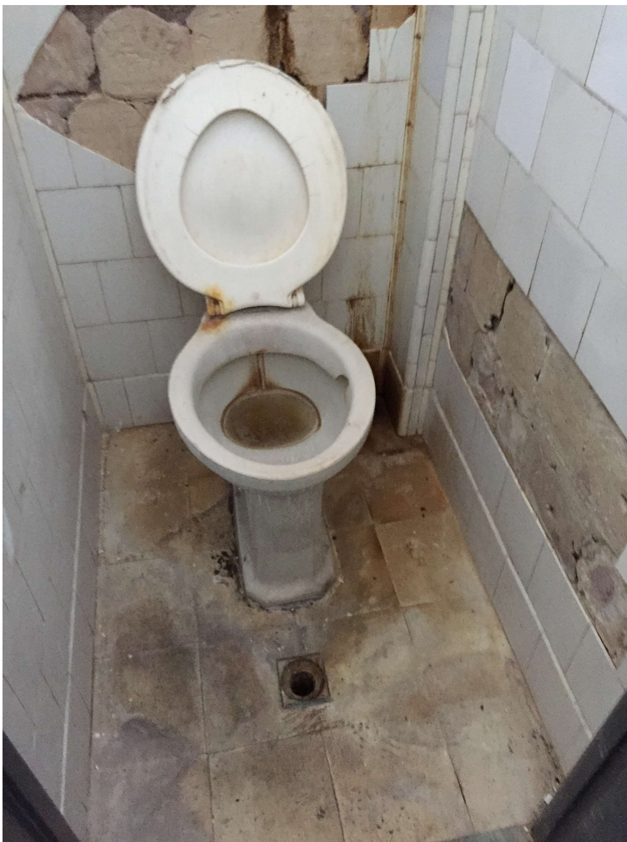
Box sector A

dri dirección sectorial de infraestructura