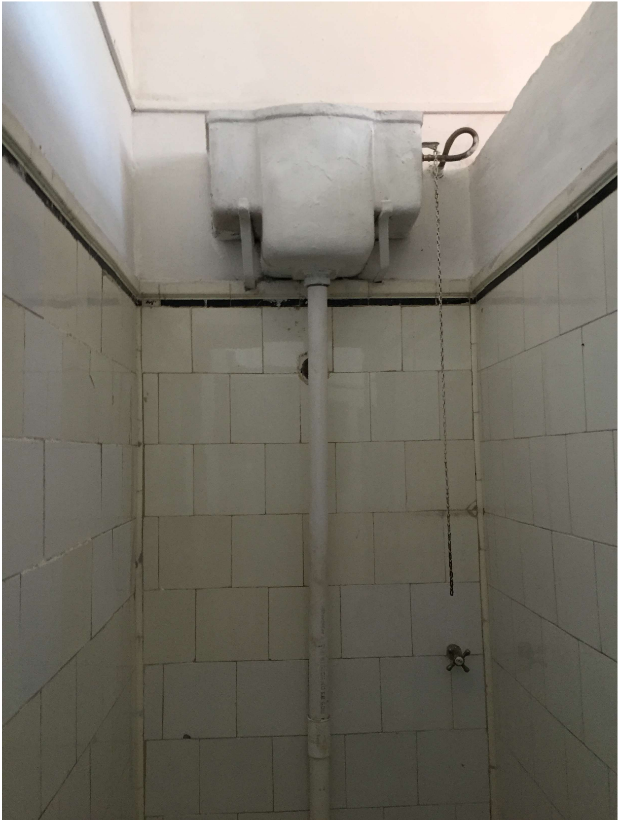
Box sector A

dri dirección sectorial de infraestructura